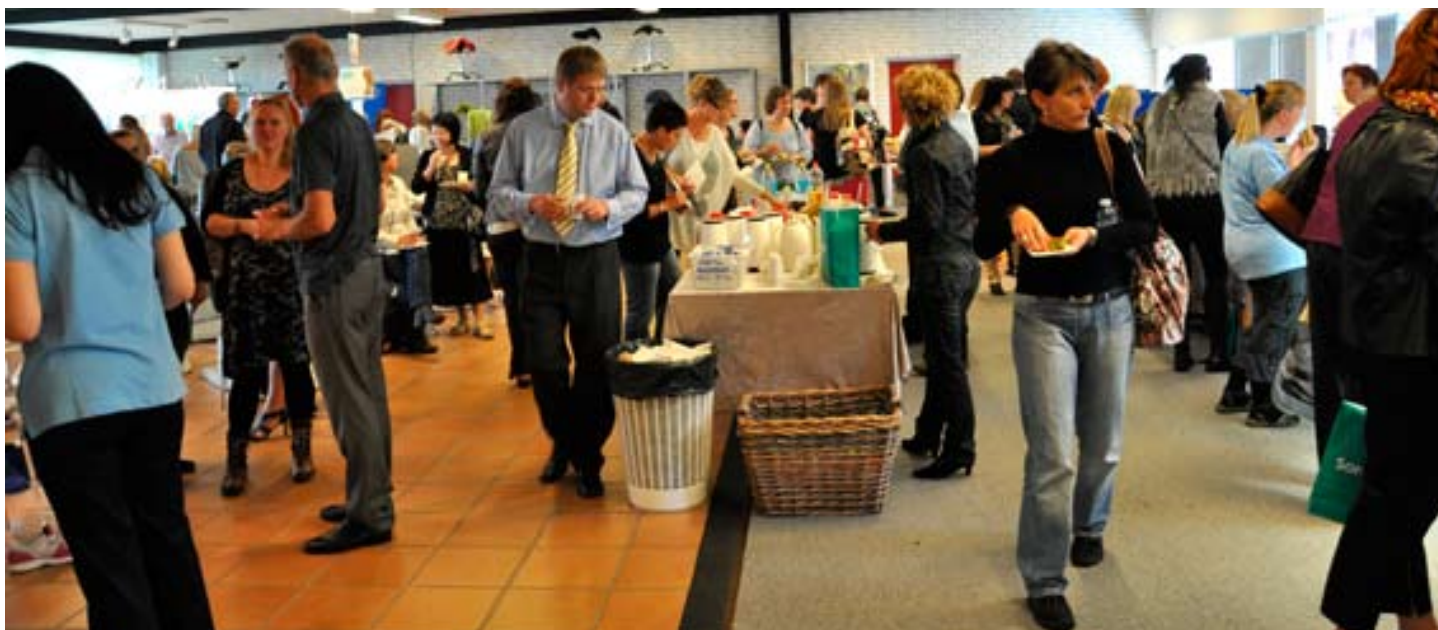
Der blev mærket og prøvet, kigget og vist og talt og bestilt og overvejet