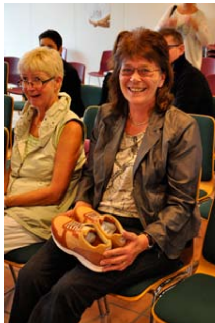
Verdens første Gait Line sko blev købt af en glad kunde i Otterup!