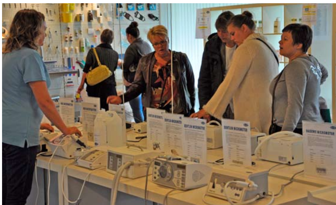
Stemningsbilleder fra messen