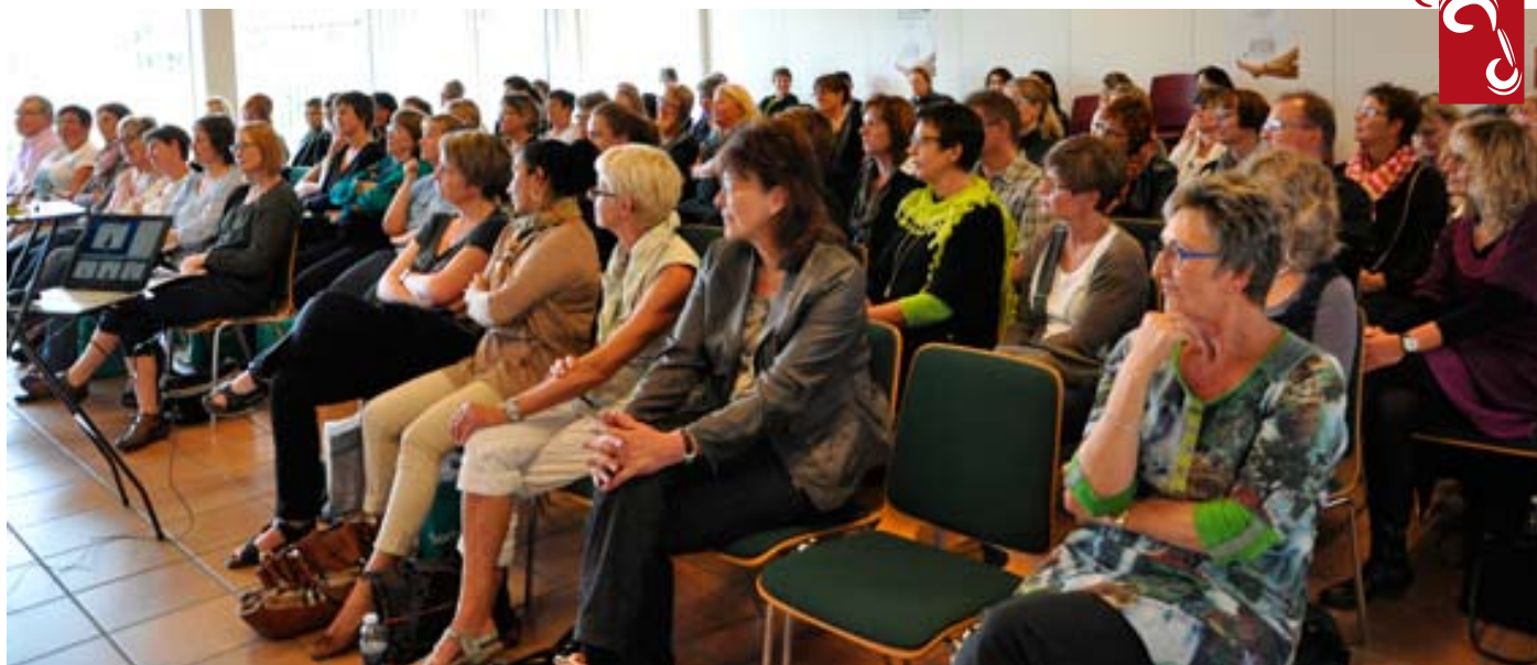
Der var masser af tilhørere til foredragene