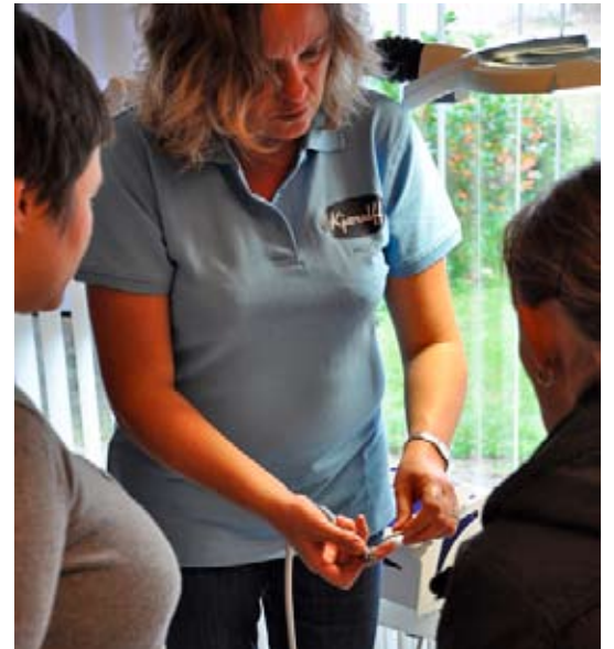
Det store klinikrum var et arbejde værksted og der var stor opmærksomhed på Omnicutten