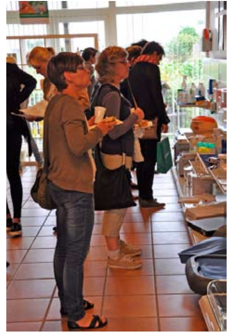
Stemningsbilleder fra messen