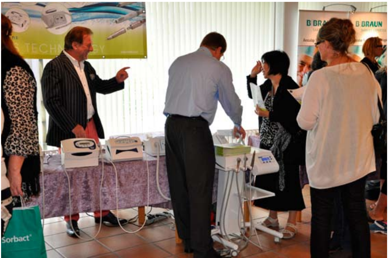
Der var også tid til lidt sjov