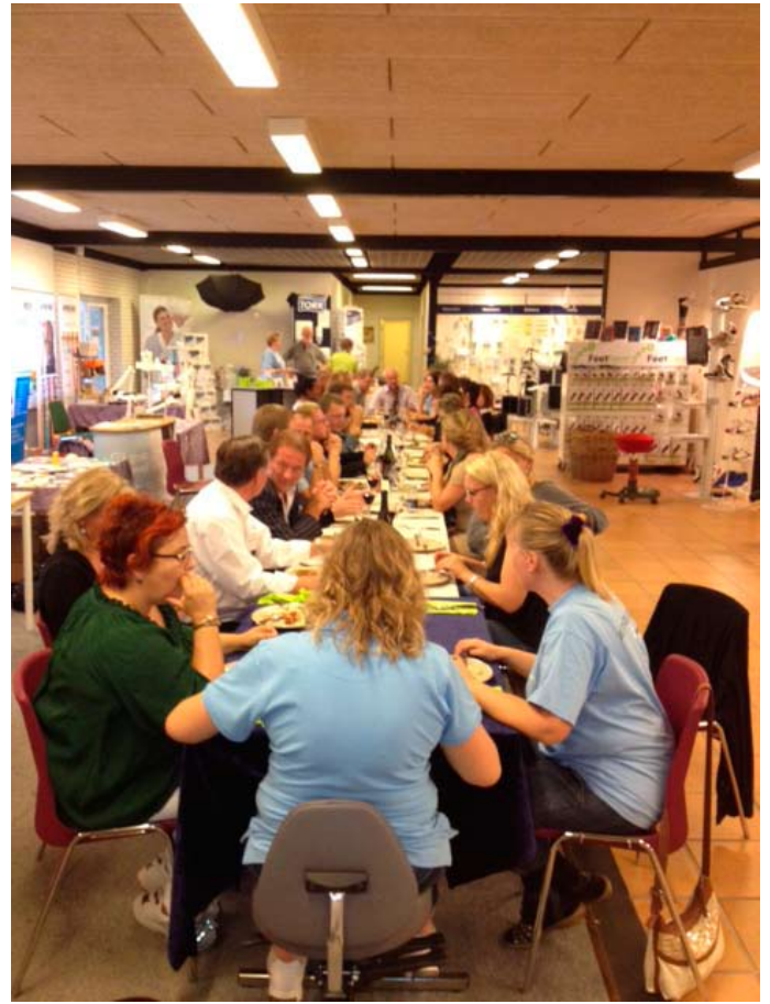
Stemningsbilleder fra grillarrangementet om aftenen med leverandører og udstillere