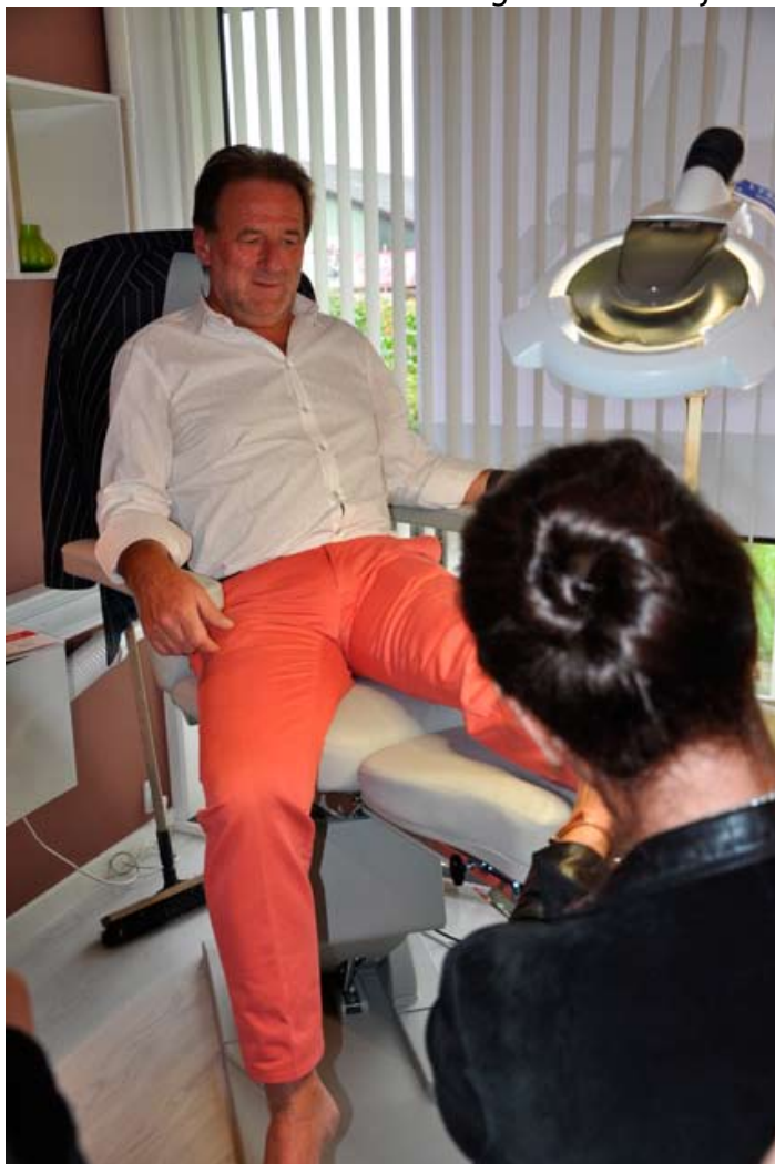
Selv leverandøren af Omnicut'en fik prøvet virkningen